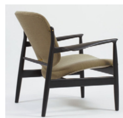
フランスチェア (No.136) W51×D46×H75 (SH45)cm オーク材、レザー 467,000円

デンマーク家具が世界で認められる先駆的な役割を果たしたフィンユールですが、そのユニークな構造から生産されず忘れられていた時期が長く続きました。2000年にハンナ夫人から権利を得たワンコレクション社は日本とCADによる図面化とNCルーターによる生産を考案してからは積極的に復刻を始めます。今回復刻されるNo.136