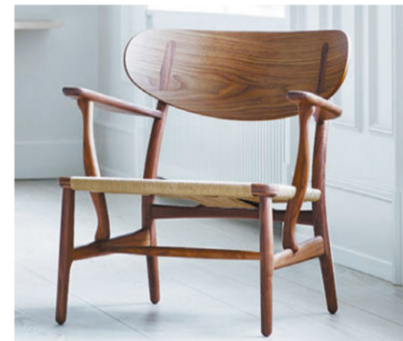
CH22イーゼルチェア W69.5×D61.5×H72.6 (SH36.8)cm ウォールナット材、ペーパーコード 347,000円

1949年カール・ハッセン&サン社の社長ホルガー・ハッセンは当時まだ無名のデザイナーだったハンス・ウェグナーを認め、椅子のデザインを依頼します。翌年彼が提出したデザインは代表作となったCH24(チェア)を始め、今回復刻されるのはその中の1点。二次元成形合板という新しい技術を取り入れた意欲的な作品で随所にウェグナーらしさが表現されています。